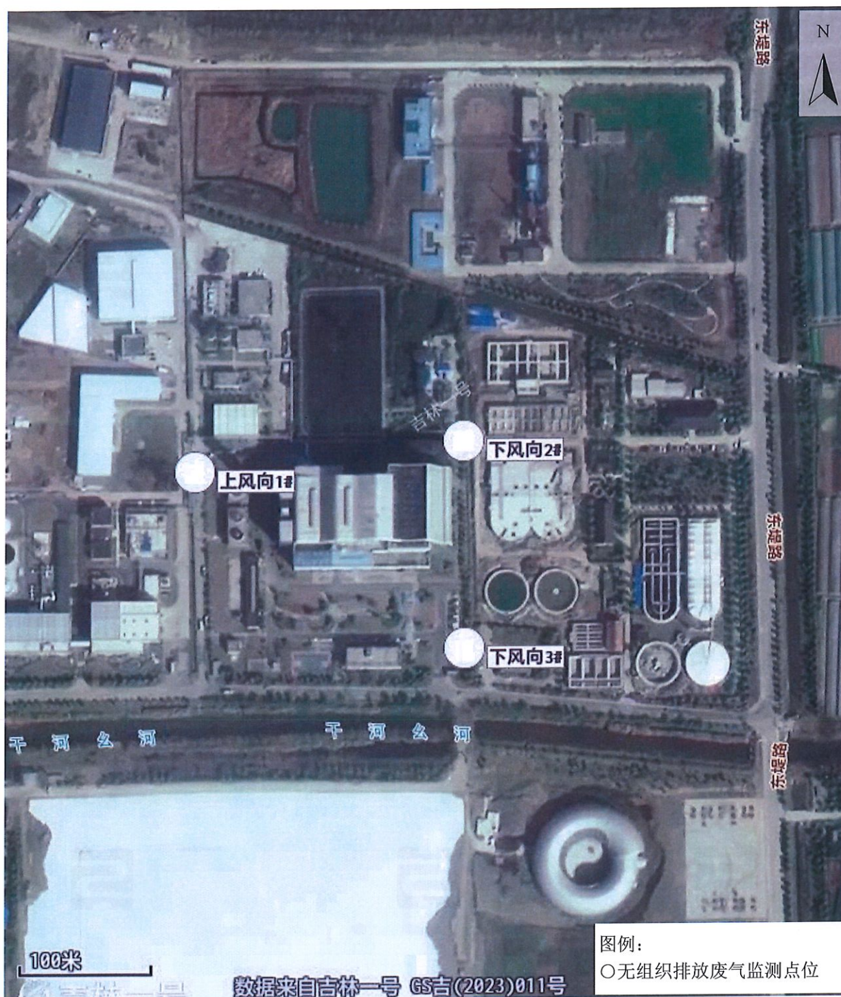
附图 1：监测点位示意图