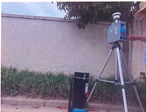
厂界上风向 1#（O1）无组织监测点位