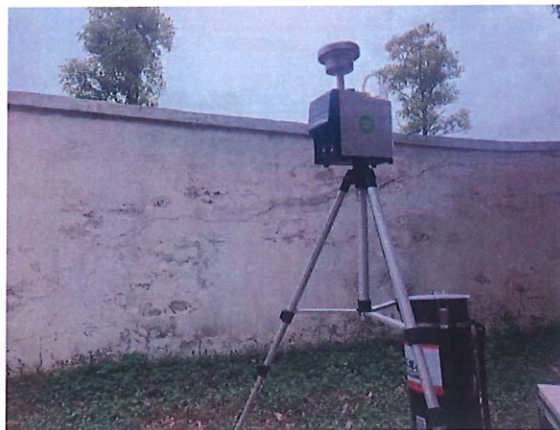
厂界下风向 2#（O2）无组织监测点位